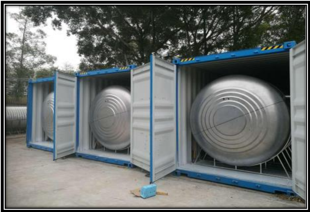
Tanque de reacción anaeróbica a temperatura constante.